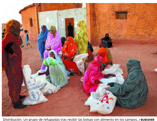
Distribución. Un grupo de refugiadas tras recibir las bolsas con alimento en los campos.

Entre las 3,5 y 4,5 toneladas ronda la media de lo que se obtiene anualmente. Una cantidad que a finales de enero desde alguna capital vasca viajará a Alicante para seguir vía marítima a Orán. El siguiente paso será cruzar Argelia para alcanzar los campamentos en el desierto argelino.