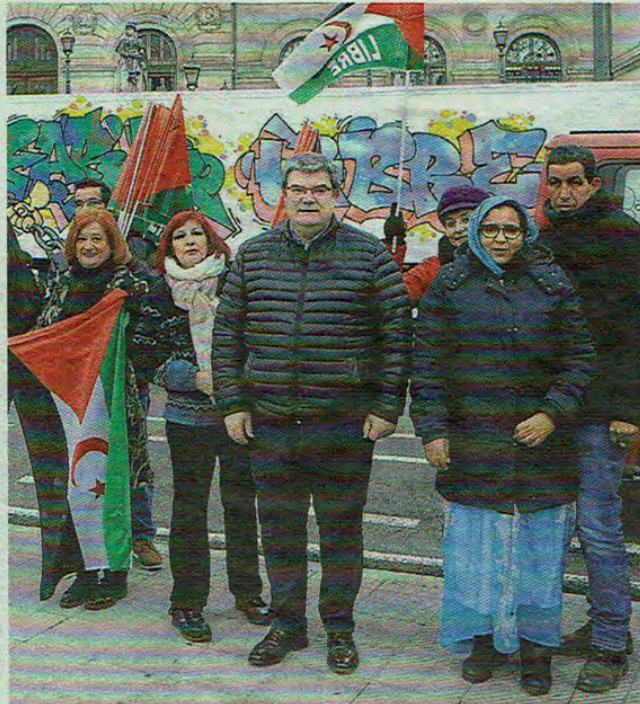
El alcalde despidió a la caravana desde el Ayuntamiento.